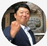
九州パトロール 株式会社 様 鹿児島／警備