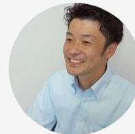
株式会社 ヨネキン 様 大阪／製造