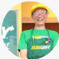
株式会社ライフ・ ライク 様 愛知／ファースト フード