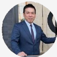
株式会社岩井製菓 様 京都／製造・飲食